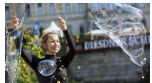
Die Schlössernacht ist keine zerplatze Seifenblase.

Am 18. Juli 2015 steigt die 7. Dresdner Schlössernacht. Die Erfahrungen der letzten Jahre zeigen, dass man die Tickets rechtzeitig lösen soll. Deshalb hat der Vorverkauf zu besonders guten Konditionen bereits begonnen. www.dresdner-schloessernacht.de