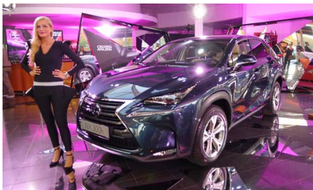
Eine glamouröse Glitzervorstellung gab es kürzlich im Lexus-Forum, als sich der neue NX vorstellte.