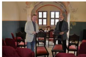
Hier kann man im Standesamt Dresden „Ja“ sagen.