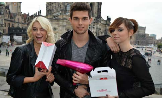
Die Models kommen frisch gestylt aus der Centrum Galerie, wo seit Montag die ganz neue Welt der Schönheit „Beauty sofort und to go“ eröffnet wurde. „Les bellista by Nocibé“ heißt das neue Konzept, das man einfach erleben muss.