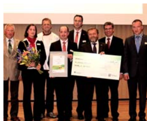
Auszeichnung des Qualitätsprogramms „Ährenwort“ mit dem Sächsischen Umweltpreis.