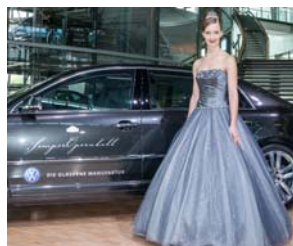
In diesem Kleid werden die Debütantinnen zum SemperOpernball 2014 Walzer tanzen.

Große Freude im Jubiläumsjahr. Das Qualitätsprogramm „Sachsens Ährenwort“ – ein deutschlandweit einmaliger Verbund sächsischer Landwirte, der Dresdener Mühle und regionaler Handwerksbäcker - wurde mit dem Sächsischen Umweltpreis Kategorie II „Umweltfreundliche Produkte“ ausgezeichnet. „Im Rahmen des Programmes „Sachsens Ährenwort“ werden jährlich 80 000 Tonnen herkunfts- und qualitätsgesicherter Weizen und Roggen aus kontrolliert-integriertem Anbau produziert und verarbeitet“, heißt es in der Pressemitteilung des Sächsischen Ministeriums für Umwelt und Landwirtschaft.