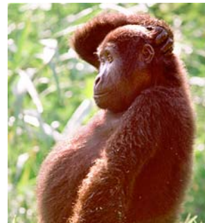
... dass sich die Stadtverwaltung wieder eine gerichtliche Belehrung anhören musste.

Am Dienstag im 16. Zivilsenat des Oberlandesgerichts. Richter Frank Bastius belehrte den Vertreter der Stadtverwaltung: „Man muss sich bei einem Ausschreibungsverfahren an die tragenden Säulen des Vergaberechts halten. Das heißt an ein Gebot der Transparenz und ein Verbot der Willkür.“ Das sah die Sandstein Neue Medien GmbH verletzt und klagte. Sie betreibt das Internetportal www.dresden.de und hatte sich auch an einer Neuausschreibung beworben. Während des Verfahrens hatte jedoch die Stadt einige Kriterien verändert, sodass die webit! das lukrative Portal bekommen sollte. Das Gericht entschied: „Alles auf Anfang!“ Die Ringrichter der Boxgala am Samstag notieren in solchem Fall: „Die Stadt in der blauen Ecke ist angezählt!“